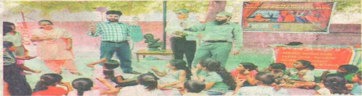
સ્લમ બાળકોને કઠપૂતળી જેવા પરંપરાગત માધ્યમ દ્વારા વિજ્ઞાનના સિદ્ધાંતો શિખવાડવા માટે એક કાર્યશાળાની શરૂઆત કરવામાં આવી છે.

ઈંગ્લિશ મિડીયમ સ્કૂલમાં અભ્યાસ કરતા કોઈ બાળકને જે વિજ્ઞાનના સૌંદર્યનિયમો બોર્ડ ઉપર લખીને સમજાવી દેવામાં આવે. ત્યારબાદ તે બાળકની પરીણા લેવામાં આવે તો તે બાળક સારા નબર સાથે પાસ થઈ જાય. પણ જો આ રીતે કોઈ સ્લમ બાળકને સમજાવીને તેની એકઝામ લેવામાં આવે તો કદાચ તે બાળક આ એકઝામમાં પાસ થઈ શકશે નહીં. કારણ કે એ બાળકના વિજ્ઞાન એટલે શું? તેનો કોઈ ખ્યાલ નથી? પરંતુ શહેરના સેટેલાઈટ વિસ્તારમાં આવેલી દેવાપિશ સ્કૂલમાં અત્યારે એવી કાર્યશાળા ચાલી રહી છે. જેમાં આ સ્લમ વિસ્તારમાં રહેતા બાળકો કે જે છુટક મજૂરી કરીને પોતાના માતા પિતાની મદદ કરે છે, તે બાળકોને પેપેટ શો (કઠપૂતળી)ના માધ્યમથી વિજ્ઞાનના સિદ્ધાંતો શિખવાડવામાં આવી રહ્યા છે. આ તમામ બાળકોને શહેરના અલગ અલગ વિસ્તારમાંથી અત્યારે આ સ્કૂલમાં લાવીને આ વિજ્ઞાનના પાઠ શિખવાડવામાં આવી રહ્યા છે. આ બાળકોને પેપેટના માધ્યમથી વિજ્ઞાન શિખવા માટે સ્પેશિયલી દિલ્હીના સાયન્સ રિપાર્ટમેન્ટમાંથી બે વ્યક્તિને બોલાવવામાં આવ્યા છે. આ વર્કશોપમાં વિજ્ઞાનના નિયમો ઉપરાંત કઠપૂતળીને કાગળમાંથી કઈ રીતે બનાવવાની, ઉપરાંત પેપેટ કઈ રીતે